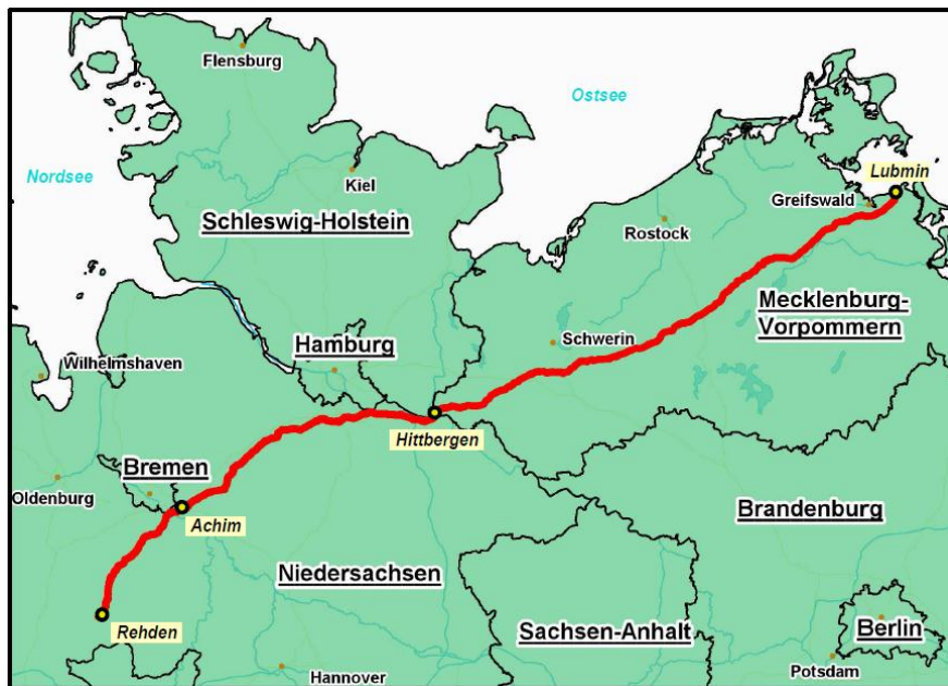
Abbildung 1: Trassenverlauf der NEL

Energieprojekten gezählt wird. Die nach der Kernkraftwerkskatastrophe in Japan beschlossene Energiewende in Deutschland verstärkt die Bedeutung solcher Erdgastransportpipelines für die Sicherung der deutschen Energieversorgung noch zusätzlich.